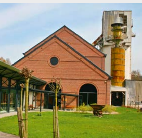
Maitres du Feu, Amay

van veelvuldige industrie-cultuurlandschappen in de kleinste ruimtelijke omgeving te leren kennen, niet het laatst ook verschillende Europese culturen en levensstijlen. Deze regio was een van de meest beduidende centra van vroege industrialisering in Europa. Kolennijnen, ertswinning, productie van ijzer- en messingwaren, lakennijverheid, pottenbakkerij; al deze ambachten hadden hier reeds globale dimensies aangenomen lang vooraleer de tijd van de industrialisering aanbrak. Vooral de Belgen zaten de technologische ontwikkeling van Groot Brittannië altijd dicht op de hielen. Vanuit Luik begonnen al die nieuwe technologieën aan hun overwinningstocht die de wereld een gans ander uitzicht zou geven: eerst in de omgeving van Aken, dan in het Roergebied en daarna ook snel op het gehele continent. De traditionele bedrijfstakken mijnbouw, laken- en metaalindustrie maakten in de laatste 50 tot 100 jaar een zware crisis door en spelen nu geen centrale rol meer. Gebleven zijn talrijke musea en monumenten die de herinnering aan de buitengewone industriegeschiedenis van de streek wakker houden. De musea uit vijf regio's werken sinds 1998 samen. De „Vereniging van de industriemusea in de Euregio Maas-Rijn“ heeft ook de regionale route van de „Europese Route van het Industrieel Erfgoed“ (ERIH) uitgewerkt evenals deze toeristische kaart. Zij nodigt u uit grenzen te overschrijden en op ontdekkingsstocht te gaan!