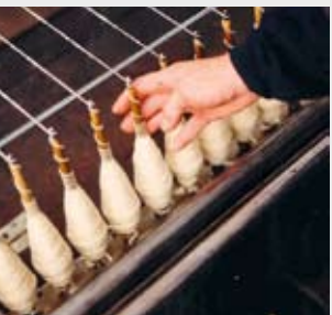
Tuchfabrik Müller, Euskirchen

Die traditionellen Industriezweige Bergbau, Tuch- und Metallindustrie erlebten in den letzten 50 bis 100 Jahren eine schwere Krise und spielen heute keine wichtige Rolle mehr. Geblieben sind zahlreiche Museen und Denkmäler, die die Erinnerung an die außergewöhnliche Industriegeschichte der Region wach halten. Die Museen aus fünf Regionen arbeiten bereits seit 1998 zusammen. Der „Verein der Industriemuseen in der Euregio Maas-Rhein“ hat eine Regionalroute für die European Route of Industrial Heritage (ERIH) und auch diese touristische Karte konzipiert, die Sie einlädt, Grenzen zu überschreiten und neue Ziele zu entdecken!